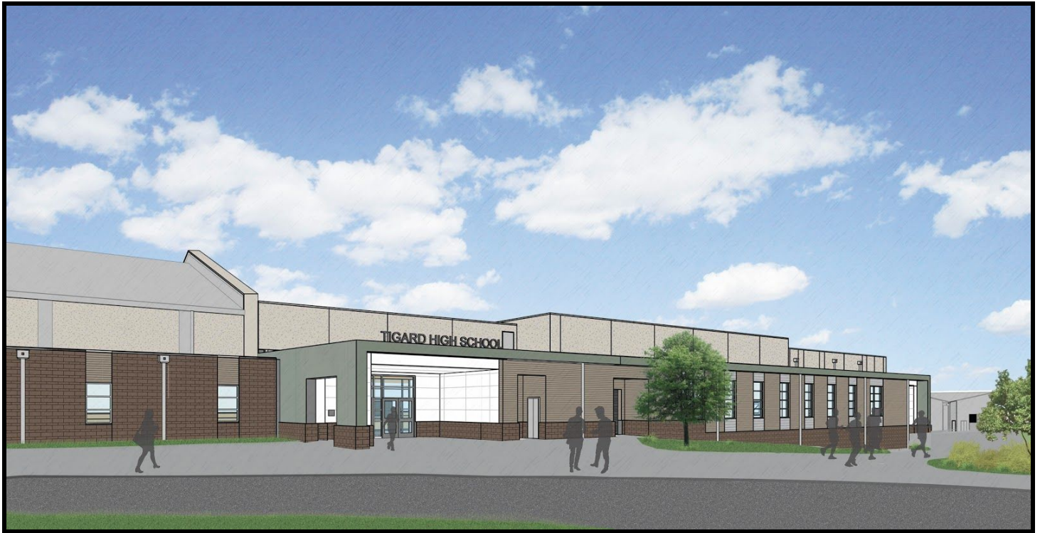
El nuevo complejo para deportes de la preparatoria Tigard en el lado oeste del campus, mirando hacia el este