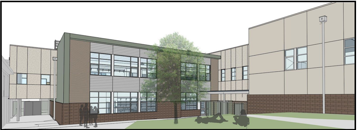
Tigard High School's new courtyard, looking south.