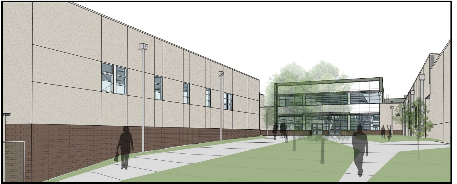
Patio de la escuela preparatoria Tigard, mirando hacia el norte a las escaleras de aprendizaje.